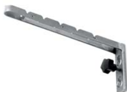
Attacco multiplo Multiple connection Support multiple Aufhängevorrichtung für Kleiderbügel