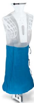
Trespola capospalla Dummy Tréteau pèlerine Puppe für Oberbekleidung