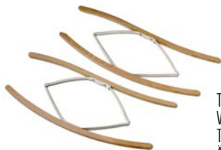
Tendimaniche in legno Wooden sleeve stretchers Tendeur pour manches en bois Armelspanner aus Holz