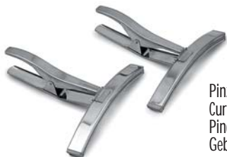
Pinze curve per giacche e cappotti Curved clamps for jackets and coats Pincés courbées pour vestes et manteaux Gebogene Klammern für Jacken und Mäntel