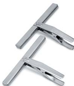
Pinze diritte per pantaloni Straight trouser clamps Pincés droites pour pantalons Gerade Hosenbeinklammern