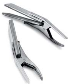
Pinze verticali Vertical clamps Pincés verticales Senkrechte Klammern