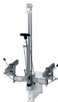
Carrello tendipantaloni scorrevole con supporto Leg stretching carriage with support Chariot coulissant pour étirer le pantalon avec support Hosenbeinspannschlitten mit Halterung