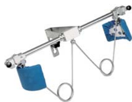
Topper stirabacino Trousers waist band stretcher Topper pour repassage du bassin Hosenbundspanner