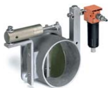
Valvola pneumatica scarico aria Pneumatic operated air discharge valve Vanne pneumatique décharge air Pneumatisches Luftablassventil