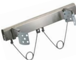
Tendibacino pneumatico Pneumatic waist band stretcher Tendeur de bassin pneumatique Pneumatischer Hosenbundspanner